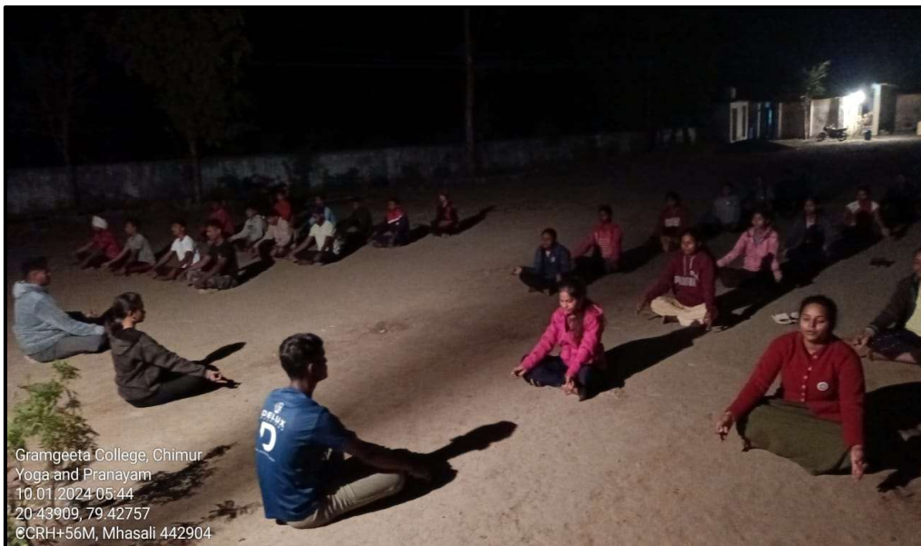
Guest delivering speech

Gramgeeta College, Chimur Yoga and Pranayam 10.01.2024 05:44 20.43909, 79.42757 ©CRH+56M, Mhasali 442904