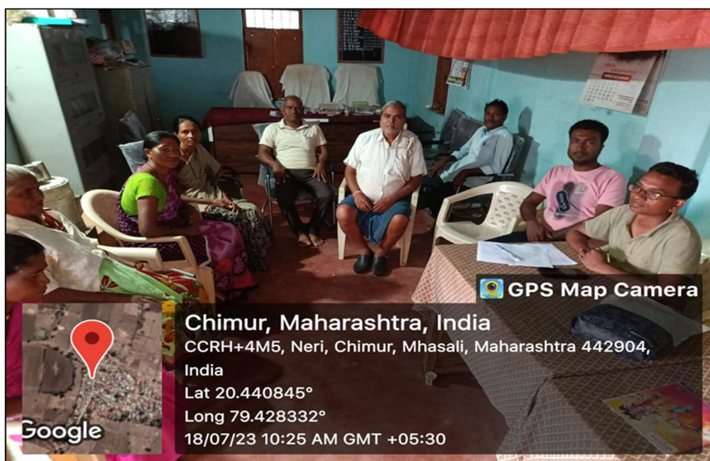
Meeting with Mahasli Gram panchayat

Various agenda including Grove planting activity (Amrit Vatika Nirman) and felicitation of army retired personnel of the area were discussed in the meeting. It was unanimously decided to organise this events on 10th of August 2023.