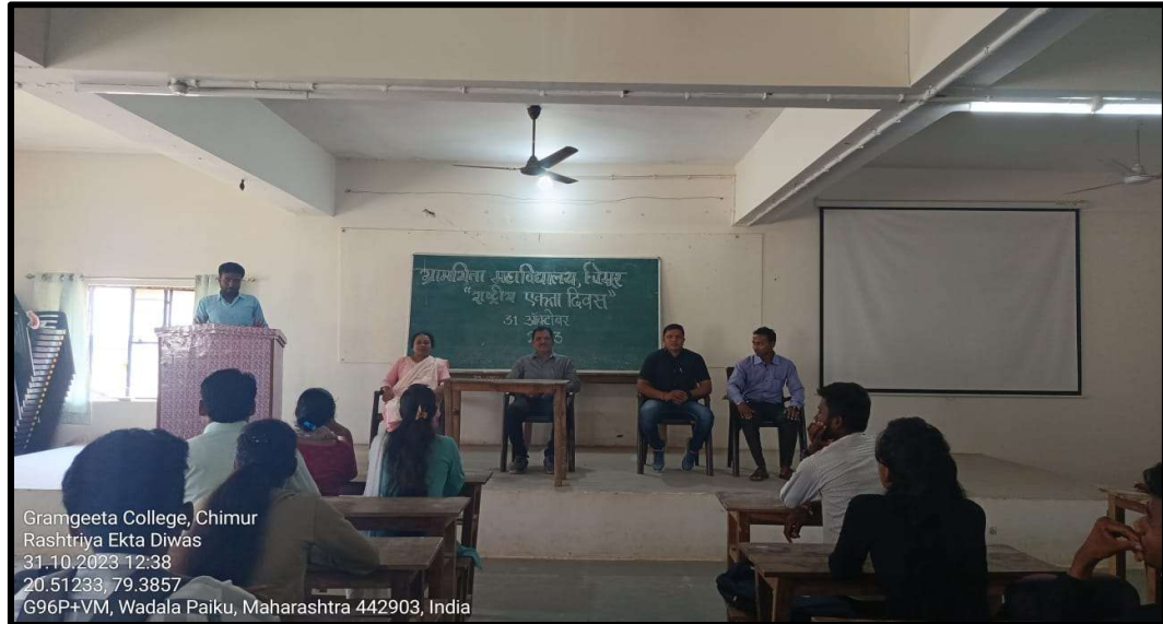
Birth Anniversary of Sardar Vallabhbhai Patel

This day was celebrated by the Department of NSS of Gramgeeta Mahavidyalaya, Chimur by taking Pledge for the Unity and Discrimination free India. Students and all the teaching & non-teaching staff were present at the event.