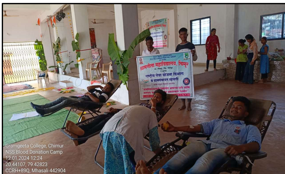
Blood Donation on National Youth Day

On this occasion, a blood donation camp was organised in the NSS camp, which was responded well by Mahasli villagers and NSS volunteers of the Mahavidyalaya.