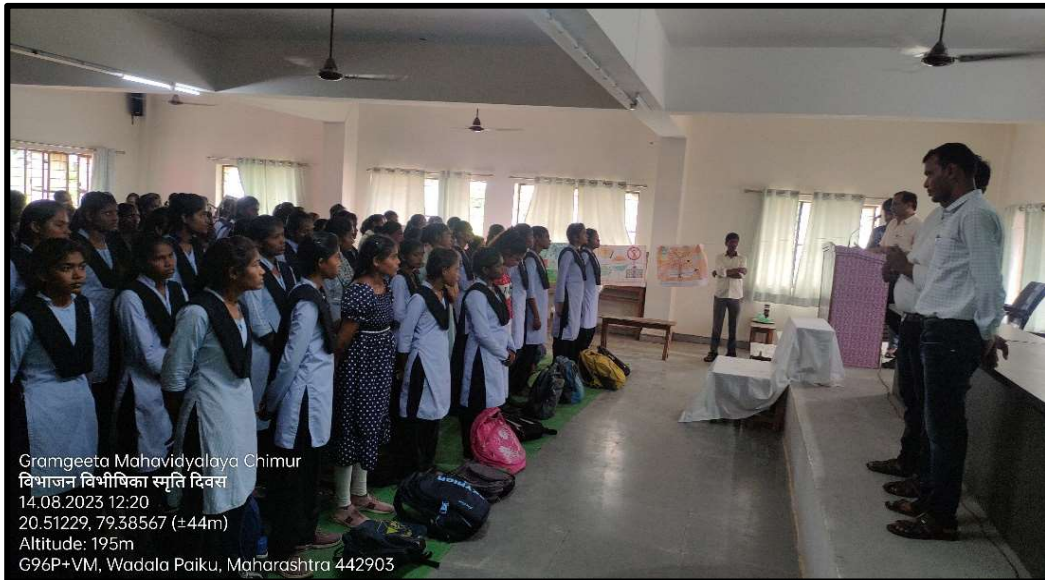
Partition Horror Remembrance Day

Partition Horrors Remembrance Day ( Vibhajan Vibhishika Smriti Din ) is an annual national memorial day observed on 14 August in India, commemorating the victims and sufferings of people during the 1947 partition of India. All the teaching and non-teaching staff and students of Gramgeeta Mahavidyalaya, Chimur has paid homage to the victims of the partition horrors.