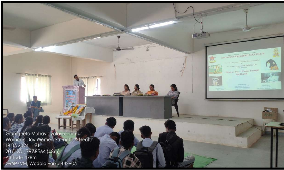
International Women's Day