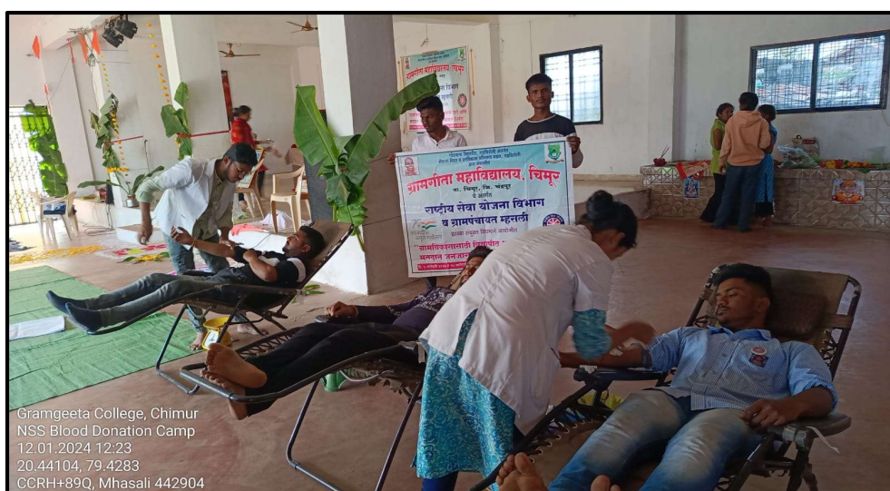
Blood Donation on National Youth Day