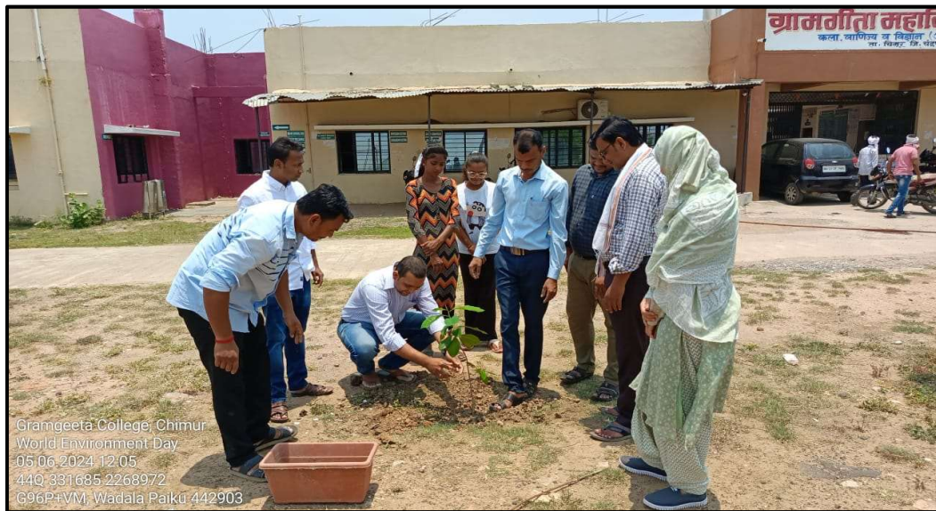
Plantation on World Environment Day

On 5th June, 2024, the world Environment Day was celebrated in the Mahavidyalaya. This year the theme for the World Environment Day was “ Land Restoration, Desertification, and Drought Resilience ”. It is celebrated to remind people about the importance of Nature and to raise awareness and generate action on a pressing environmental issue. On this occasion, tree plantation was done in the College premises and students were motivated to keep their surrounding clean and pollution free. They were also suggested to encourage other people around them to do the same.