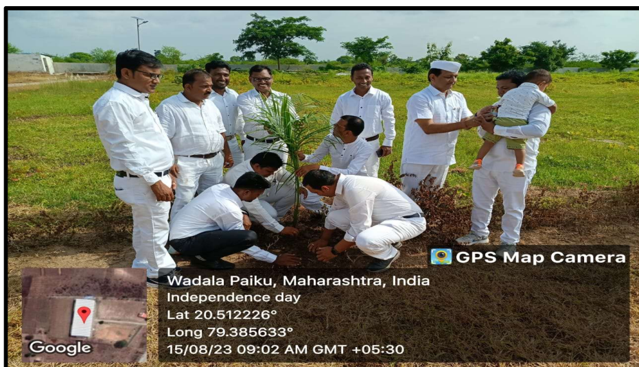
Tree plantation on Independence Day