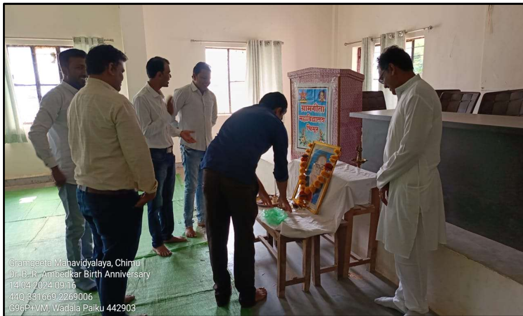
Dr. B. R. Ambedkar Birth Anniversary

On 14th April 2024, the Gramgeeta Mahavidyalaya, Chimur has celebrated the Birth Anniversary of Dr. Babasaheb Ambedkar and remembered his contribution for the nation. All the teaching and non-teaching staff were present during the event.