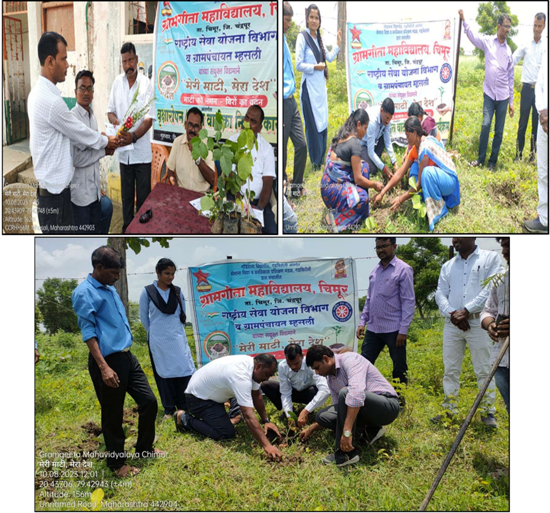
Veero ka Samman & Amrit Vatika Nirman