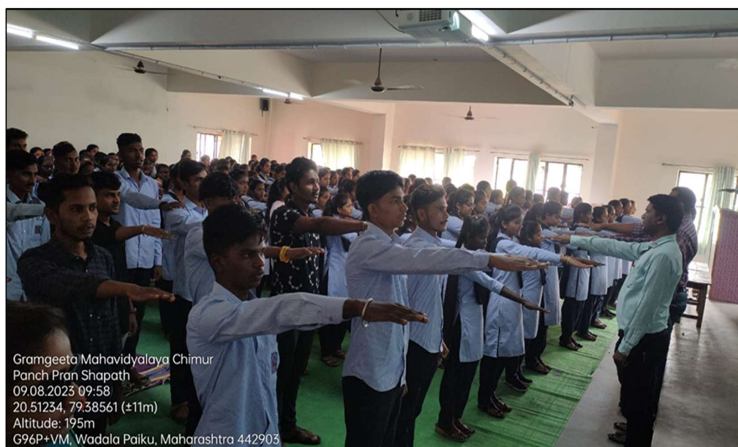
Panchpran Shapath by students and staff

On 9th August 2023, following the instructions from Ministry of Higher and Technical Education, Maharashtra, the department of NSS of Gramgeeta Mahavidyalaya, Chimur has organised 'Panch Pran Shapath' program at 10:00 a.m. in the seminar hall of the Mahavidyalaya. About 60 volunteers, 250 students and all the teaching and non-teaching staff of the Gramgeeta Mahavidyalaya has participated in the event.