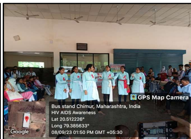
Street Play for Awareness