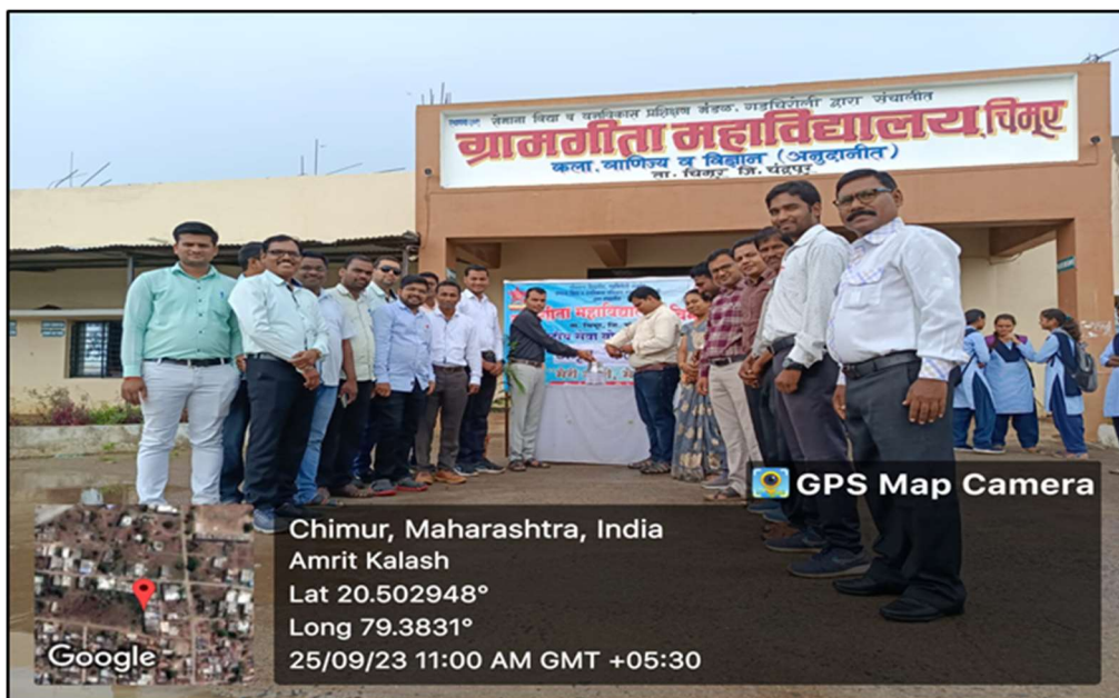
Amrit Kalash Sankalan