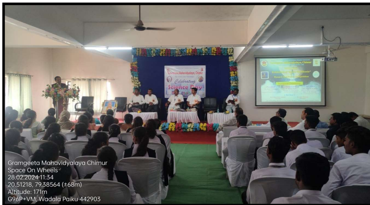
National Science Day