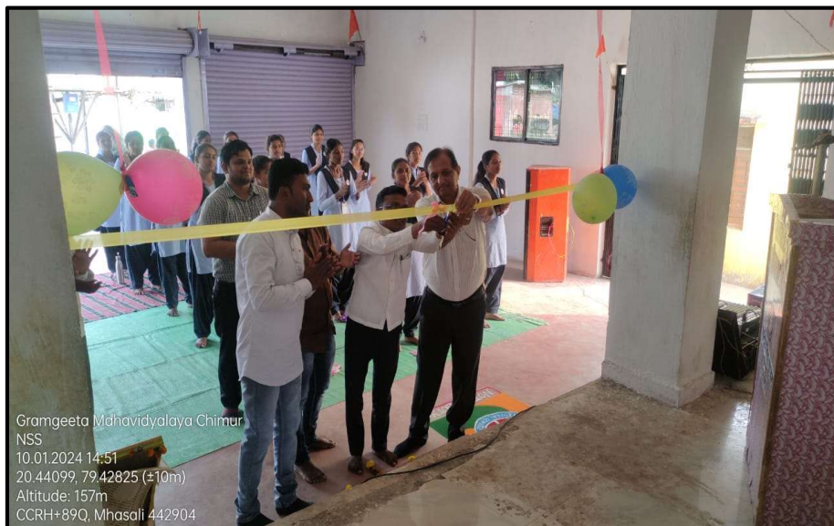
Inauguration of NSS Special Camp